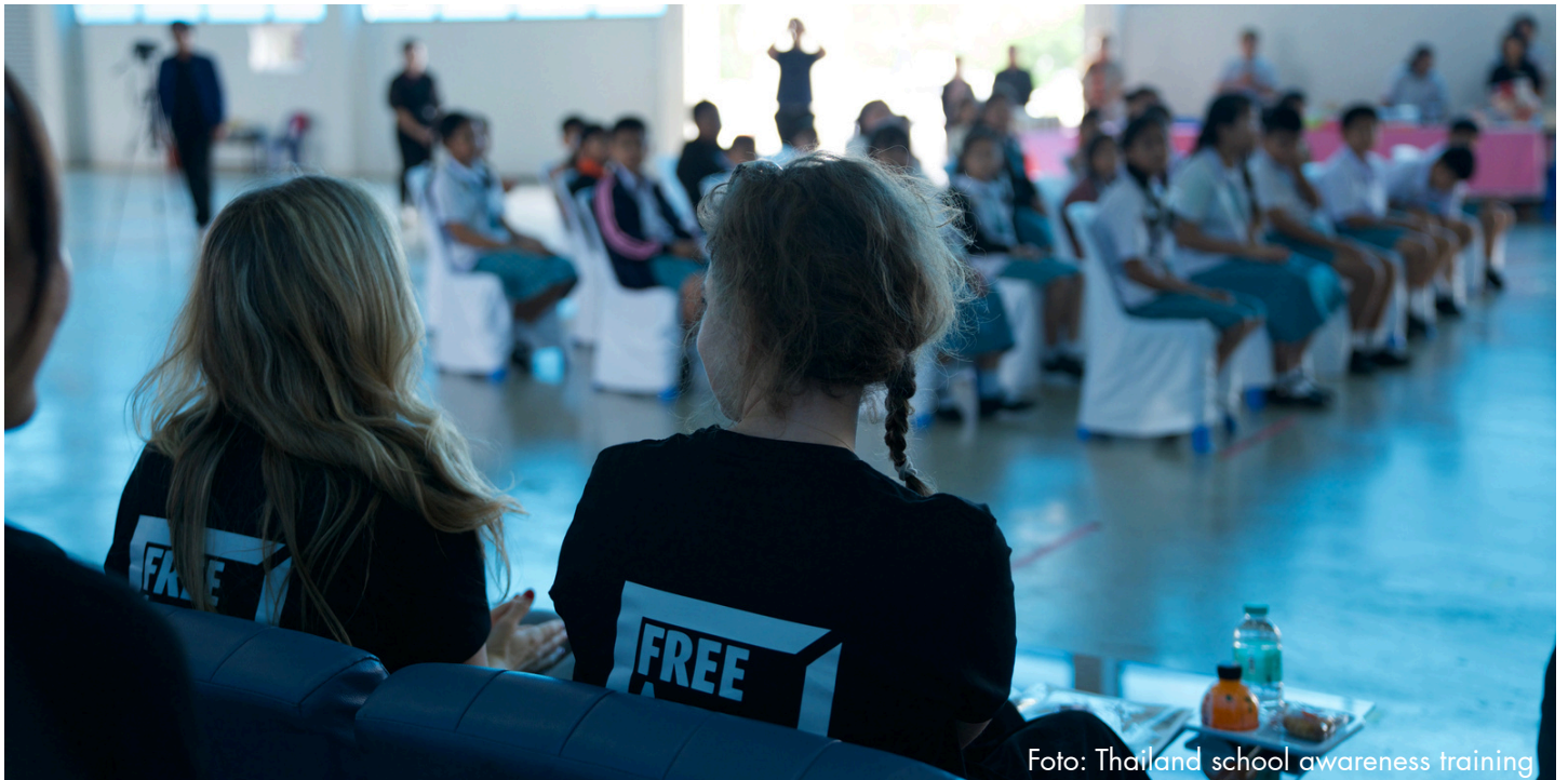
Foto: Thailand school awareness training

Deze keuzes werkten in 2025 door in de verdere ontwikkeling van de strategische programmaliĳnen Rescue, Empower en Justice. Ook kregen zij vorm in de versterking van School for Justice als internationaal programma waarin ervaringsdeskundigheid, leiderschap en toegang tot gerechtigheid samenkomen. Tegelijk bevond Down to Zero zich in een afrondende fase. Daardoor stond 2025 niet alleen in het teken van uitvoering, maar ook van voorbereiding op een volgende fase voor Free a Girl.