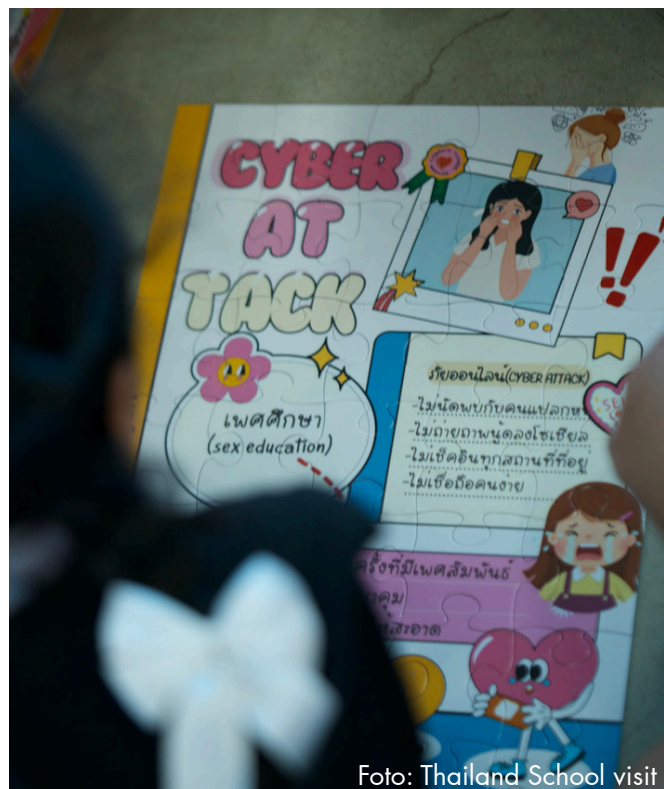
Foto: Thailand School visit

Een vierde risicogebied betreft reputatie en externe samenwerking. In 2025 groeide de zichtbaarheid van Free a Girl via ambassadeurs, campagnes, media-optredens, evenementen en samenwerking met bedrijven en andere partners. Deze zichtbaarheid droeg bij aan bewustwording, netwerkversterking en fondsenwerving, maar vergroot ook het belang van zorgvuldige afwegingen bij publieke uitingen en externe samenwerking. Free a Girl heeft daarom duidelijke afspraken met ambassadeurs en blijft alert op mogelijke reputatierisico's in relatie tot ambassadeurs, bedrijven, campagnes en publieke positionering.