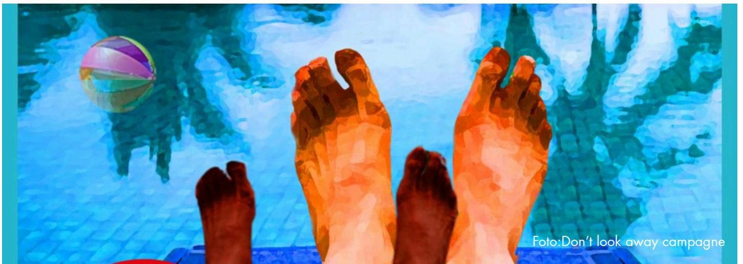
Foto: Don't look away campagne

De opbrengst van deze samenwerkingen lag in 2025 niet alleen in gezamenlijke activiteiten, maar ook in versterking van relaties, inhoudelijke uitwisseling en een stevigere positionering van Free a Girl binnen relevante netwerken. Voor Free a Girl is samenwerking geen doel op zich, maar een voorwaarde om op thema's die een gezamenlijke aanpak vragen, meer invloed en impact te bereiken.