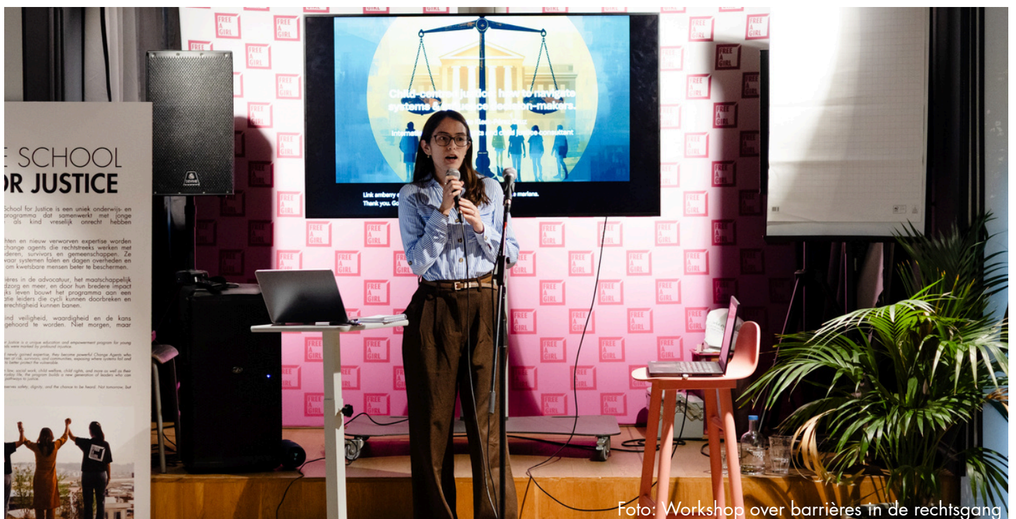
Foto: Workshop over barrières in de rechtsgang

Toegang tot gerechtigheid gaat niet alleen over het starten van een zaak of het behalen van een veroordeling. Het gaat ook over erkenning, bescherming en het serieus nemen van de stem van survivors. Justice betekent daarom dat survivors niet alleen juridisch worden ondersteund, maar ook beter worden toegerust om keuzes te maken en hun rechten te kennen.