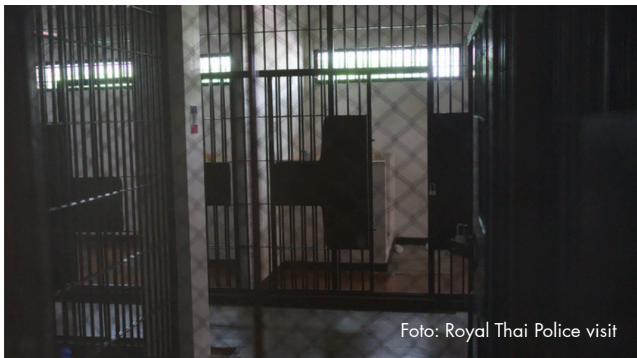
Foto: Royal Thai Police visit

Duurzame verandering vraagt ook om een rechtssysteem dat kindvriendelijker werkt. Daarom werden in 2025 ook 2.564 professionals in de overheids- en justitieketen getraind in kinderrechten. Daarmee investeerden onze programma's in professionals die signalen beter kunnen herkennen, zorgvuldiger kunnen handelen en meer oog hebben voor de positie en bescherming van kinderen. Zo draagt Justice niet alleen bij aan individuele toegang tot gerechtigheid, maar ook aan een systeem dat kinderen beter beschermt.