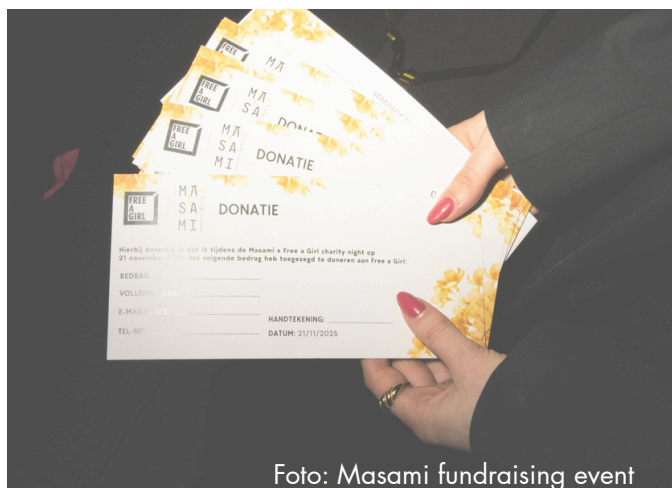
Foto: Masami fundraising event