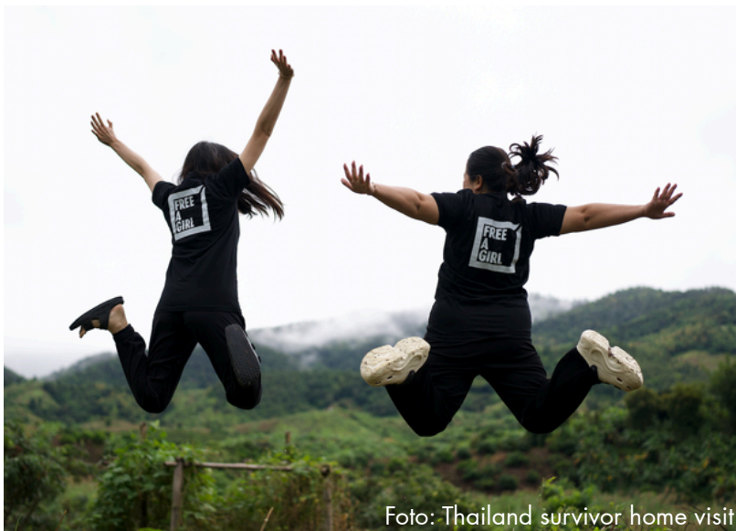
Foto: Thailand survivor home visit