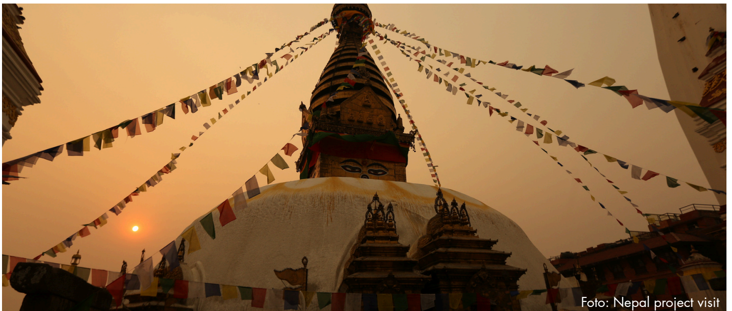
Foto: Nepal project visit

Het positieve resultaat over 2025 wordt ingezet in lijn met het reservebeleid. Dit betekent dat beschikbare overschotten worden gebruikt om de continuïteitsreserve op peil te houden, de financiële weerbaarheid van de organisatie te versterken en gerichte investeringen in projecten en programmaontwikkeling in 2026 mogelijk te maken. De omvang en mutaties van de reserves zijn nader toegelicht in de jaarrekening.