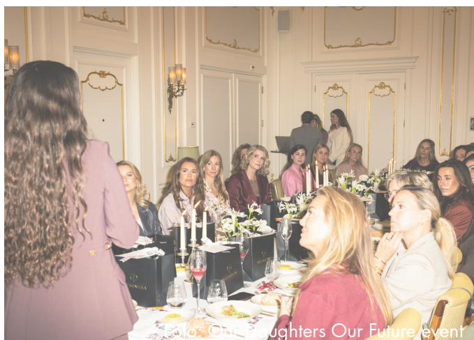
Foto: Our Daughters Our Future event

Financieel gaat Free a Girl in 2026 uit van een sluitende begroting met € 2.037.000 aan baten en € 2.037.000 aan lasten. Daarmee kiest de organisatie voor financiële consolidatie, met ruimte voor verdere programma ontwikkeling binnen een bredere en duurzamere inkomstenmix.