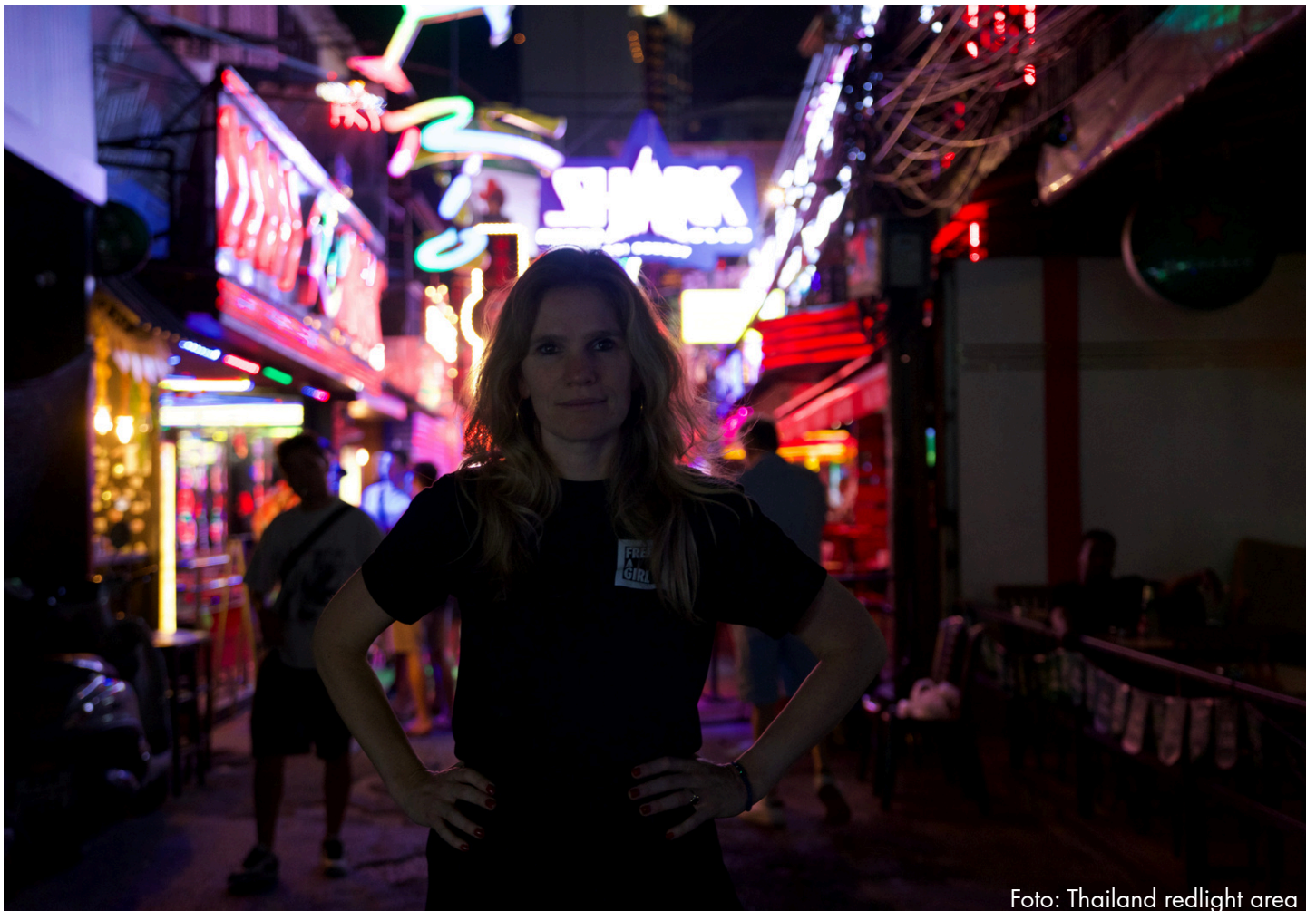
Foto: Thailand redlight area

In 2025 werkte Free a Girl aan de verdere uitvoering en versterking van bestaande programma's, waaronder Down to Zero en School for Justice. Down to Zero is een tienjarig, door het Ministerie van Buitenlandse Zaken gefinancierd programma tegen seksuele uitbuiting van kinderen, uitgevoerd in 14 landen. School for Justice is een door Free a Girl ontwikkeld internationaal programma dat survivors ondersteunt bij onderwijs, welzijn en het inzetten van hun ervaringsdeskundigheid voor betere bescherming van kinderen.